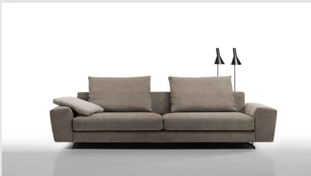
Hansen / 2 brazo sofá , 1 módulos de 212 , respaldos de 80 cm .

( EN ) Hansen shares modularity with his "brother" Arnett maintains the simple and well-proportioned lines of this but in this case the seats are independent of the structure. Lacquered metal skates keep the pieces suspended in the air. The modules can be completed with backrest cushions of different sizes and optional armrests.