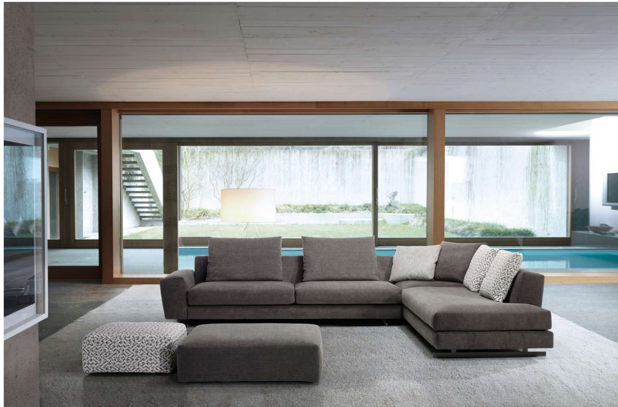
Hansen / 1 brazo sofa , 1 módulos de 212 , 1 rincón , 1 terminal 172 respaldos de 80 y 60 cm . Zenith / pouff 65x65 ,100x100