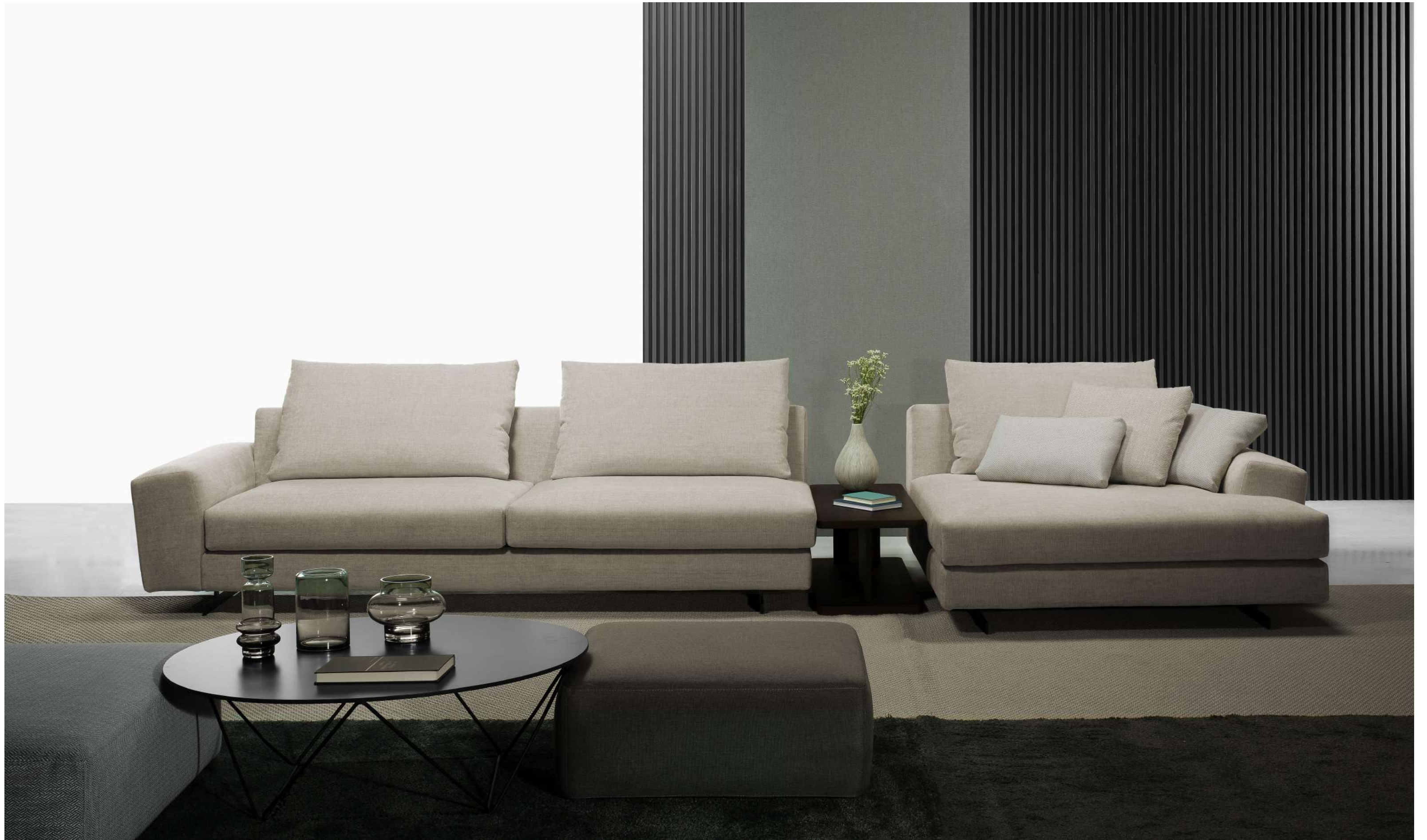
Hansen / 1 brazo sofa , 1 módulos de 212 , 1 chaise cuadrada 145x145 , respaldos de 80 cm .