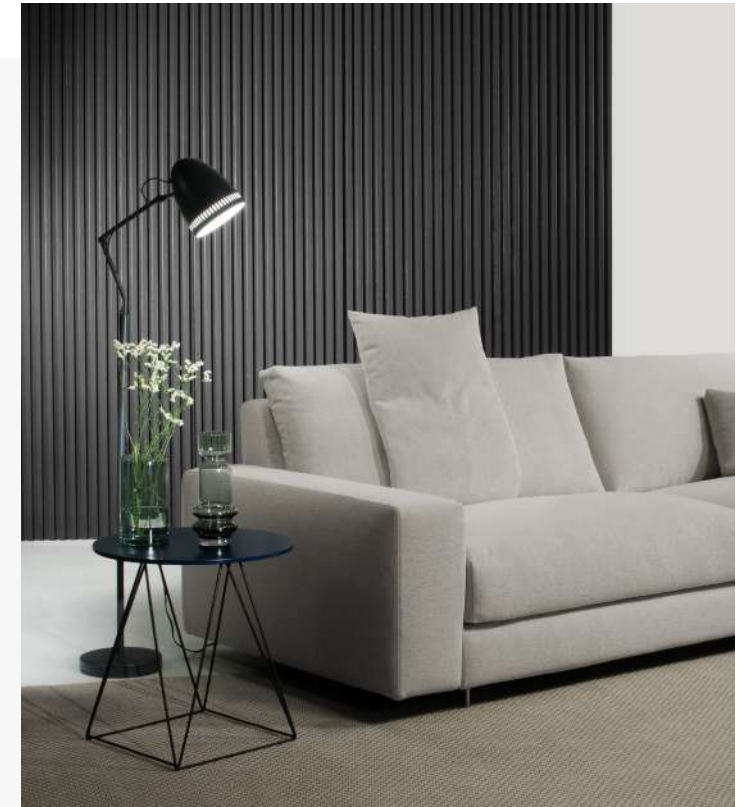
Miller / sofa 258 cm .