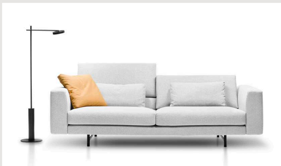
Archer / 1 sofa 250 con dos brazos.

Archer allows us, depending on our needs, to have an elegant, sophisticated and urban sofa with its backrests in a low position or a comfortable sofa where we can relax after a hard day's work by positioning the backrests in a high position.