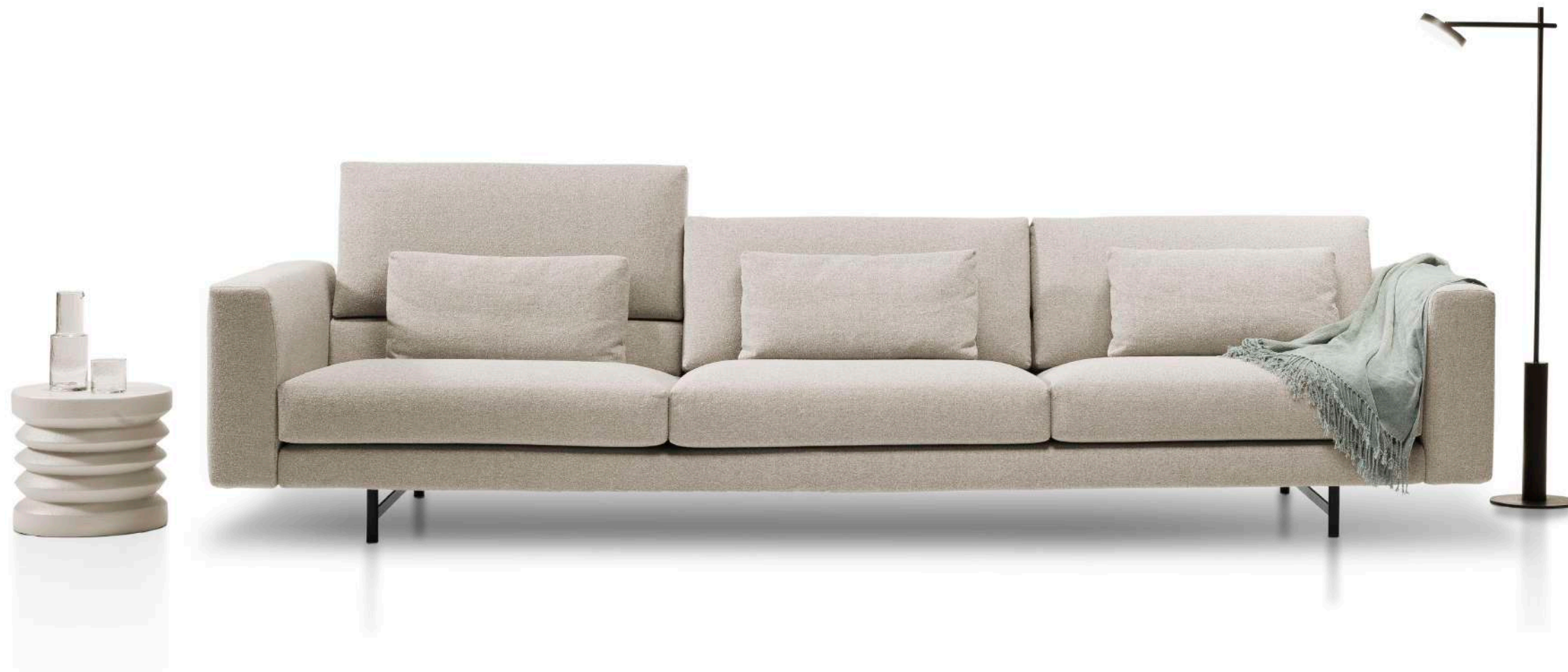
Archer / 1 sofa 326 con dos brazos ( tres asientos , tres respaldos ).